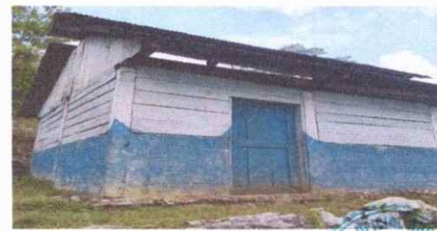
Foto 6: COCINA EN MALAS CONDICIONES, PUERTAS, TECHOS Y PISO DECONCRETO NECESITAN MANTENIMIENTO.

Observación: Si es necesario se pueden agregar hojas adicionales y actualizar el número de hojas.