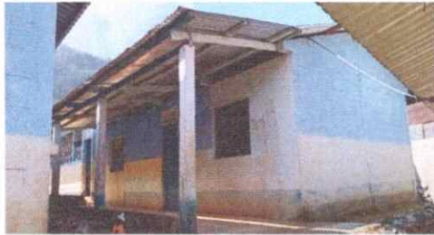
Foto 3: MODULO 3: PANORAMICA ESTADO DE MODULO, CON PUERTAS, VENTANAS Y TECHOS EN MAL ESTADO.